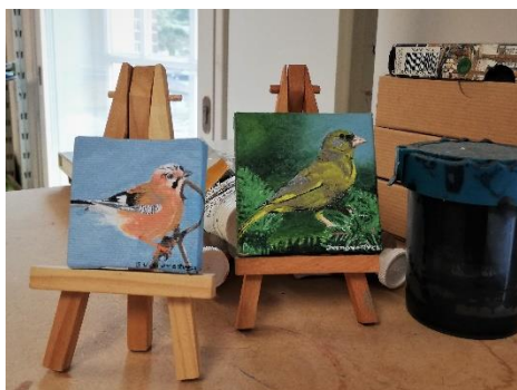
In het Atelier

We namen ook een kijkje in de (Cordaan)ateliers van de huidige getalenteerde kunstenaars. Hun kunstwerken zijn te zien (en te leen) in de Artotheek van het Outsider Art Museum.